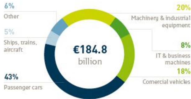
Рис. 1. Объемы взятого в лизинг оборудования в Европе 2009 г.*